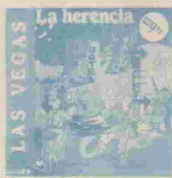
LAS VEGAS Ref: HBS-LVGINM

Partiendo de Roma has de conquistar las tierras del imperio romano. Debes conquistar alrededor de 400 ciudades de Europa y Africa. Dispones de ingenieros, barcos, tropas, catapultas, oro y caballos que te ayudarán a conseguirlo. Va incluido un poster con el mapa de instrucciones de todo el territorio.