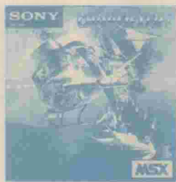
CHOPLIFTER Ref: HBS-G019CP CARTUJO

La misión consiste en rescatar 64 rehenes que se hallan en cuatro barracones abandonados. Aviones de caza y tanques enemigos tratarán de derribar tu helicóptero.