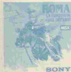
ROMA: CONQUISTA DEL IMPERIO Ref: HBS-IDE07 CASSETTE

La misión consiste en rescatar 64 rehenes que se hallan en cuatro barracones abandonados. Aviones de caza y tanques enemigos tratarán de derribar tu helicóptero.