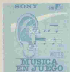
MUSICA (NOTAS) Ref. HBS-DA104 CASSETTE

Tema: secuencias temporales. El niño debe descubrir la relación tiempo-espacial que une a varias viñetas, para poderlas ordenar según el criterio descubierto. Le desarrolla la capacidad de realizar series ordenadas y lo prepara para descubrir la relación de orden en la serie numérica. Colección de 13 títulos desde HBS-AN014 a HBS-AN026.