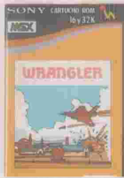
JETSETWILLY Ref: BC-M3 WRANGLER Ref: HBS-I041