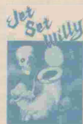
JET SET WILLY Ref. BC-M3

Primera parte del curso elemental de solfeo que trata de los sonidos y su representación: lectura de notas, escritura de notas, intervalos, tonos, dictado musical, etc.