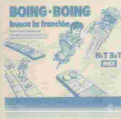
BOING! BOING! Ref: HBS-IDE03

Juego de intriga y misterio. Eres miembro de una agencia secreta de detectives y debes recuperar una fuerte suma de dinero de un "capo mafioso" en Las Vegas. Gráficos de alta resolución.