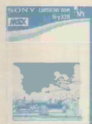
WRANGLER Ref. HBS-I041

Acción. Ayuda al muchacho a salir del laberinto. Se verá implicado en misiones especiales para poder salir.