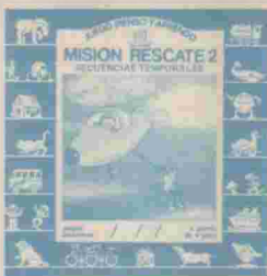
MISION RESCATE-2 Ref. HBS-AN024 CASSETTE

Tema: secuencias temporales. El niño debe descubrir la relación tiempo-espacial que une a varias viñetas, para poderlas ordenar según el criterio descubierto. Le desarrolla la capacidad de realizar series ordenadas y lo prepara para descubrir la relación de orden en la serie numérica. Colección de 13 títulos desde HBS-AN014 a HBS-AN026.